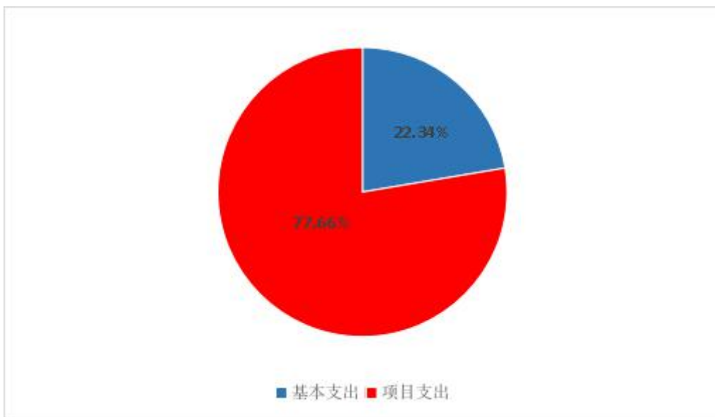
图 2：基本支出和项目支出情况